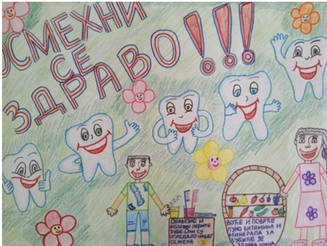
Ликовни радови ученика V–VIII разреда основне школе