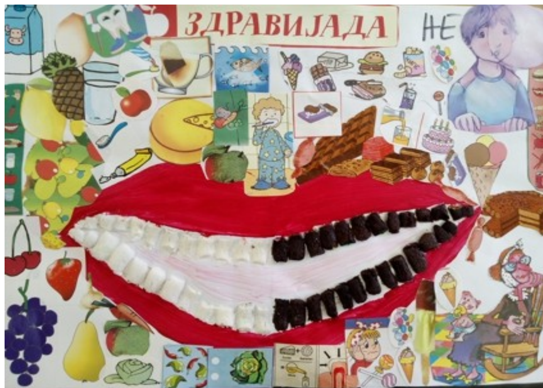
ПУ „Лане”, ППГ Гуњаци, Осечина, Ваљево