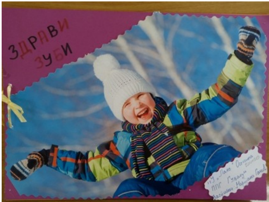
Ликовни радови ученика I–IV разреда основне школе