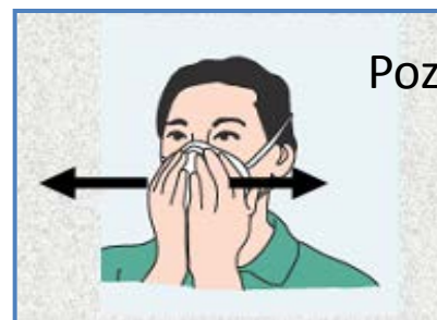
Pozitivni test prijanjanja